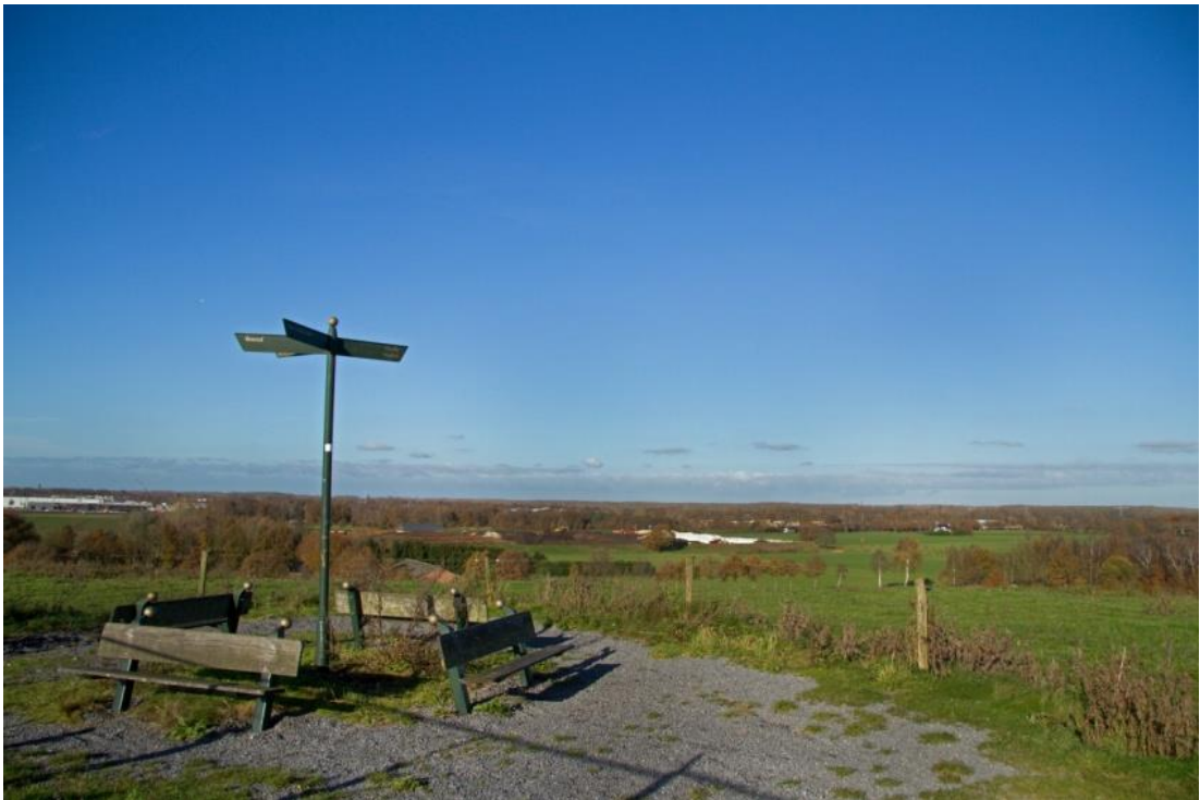
Foto telpost de Vlagheide in Schijndel

Door de Corona hebben we verder niet echt wat gedaan of kunnen organiseren.